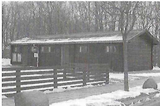
Det gamle klubhus: Her er mange gode minder gemt.