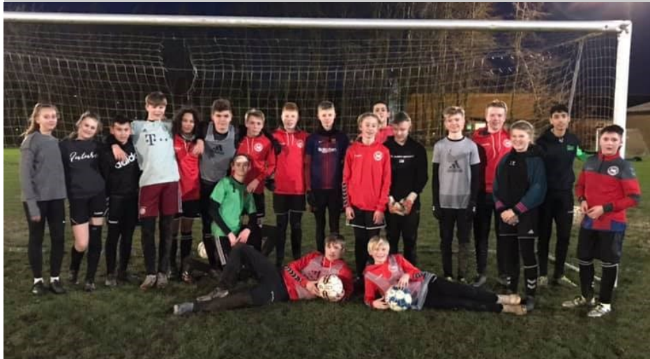
20 drenge og piger til den første udendørs træning i blæsevejr og smadder.

Brug bolden fornuftigt. Bliv medlem af 3F Als i Guderup.