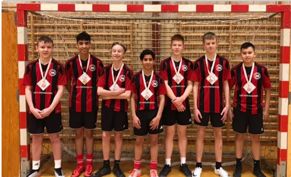
U15-Regionsmestre efter tre sejre og en uafgjort.